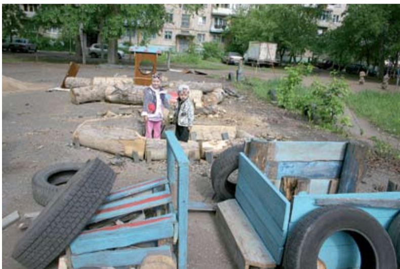
Сегодня доски и шины — завтра детские машины