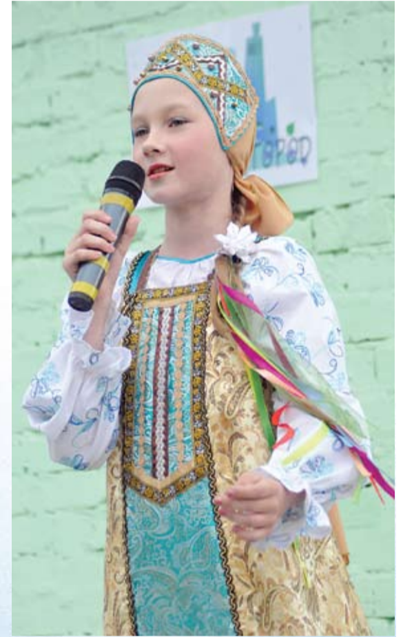
К Дню России сотни кустов сирени посадили в своих дворах жители Советского округа. Акцию «Сиреневый город» для омичей придумала студенческая общественная организация «ПаРи», а организовали НПО «Мостовик» и ООО «ЖКХ «Сервис».